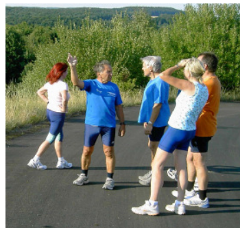
Wo war doch gleich .... ?