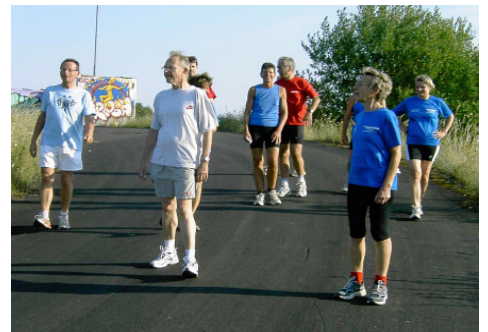
Zeit zum erforschen